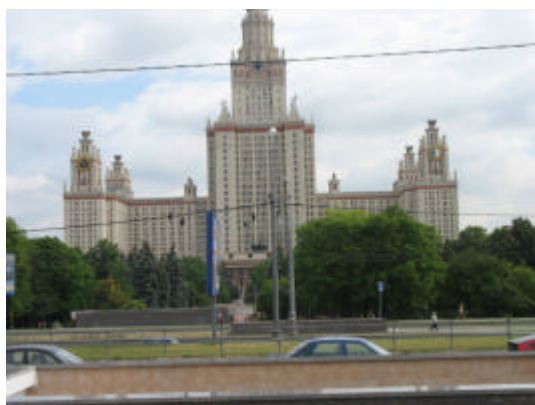
MSU, Moscow State University